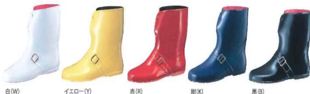
白 (W) アイエロー (Y) 赤 (R) 紺 (K) 黒 (B)