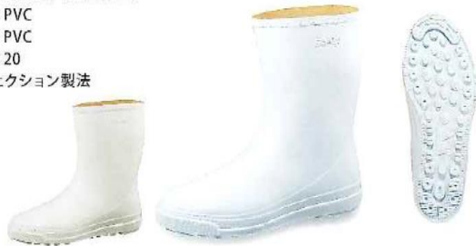
アイボリー (IV) 白 (W)