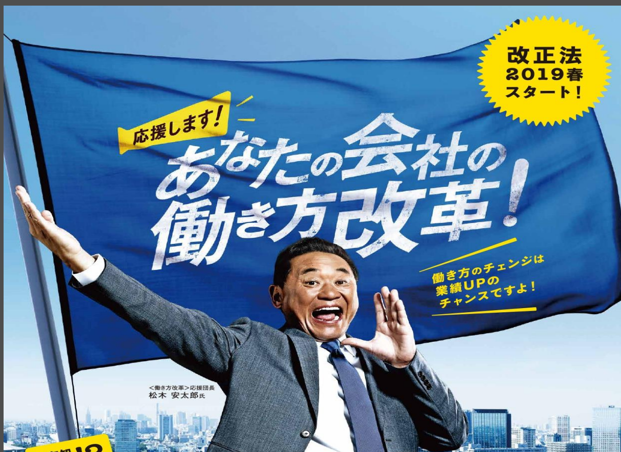
<働き方改革>応援団長 松木 安太郎氏